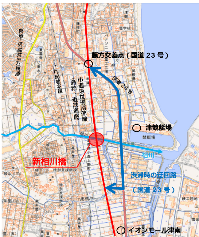
位置図（上方向が北）