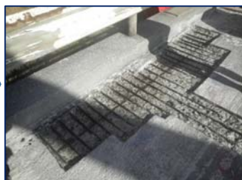
床版の傷んだ部分を取り除く