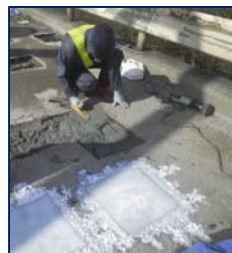
樹脂モルタル補修