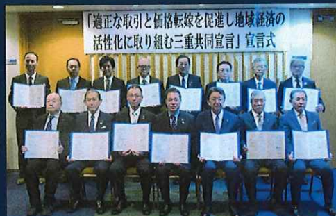
2024年4月25日 (木) 共同宣言式