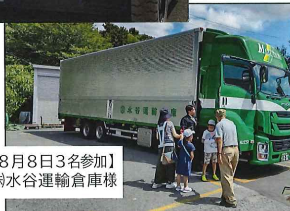
【8月8日3名参加】 (株)水谷運輸倉庫様