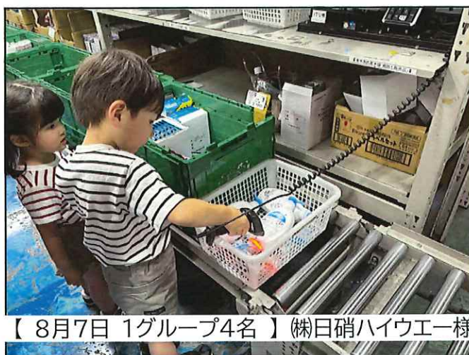
【8月7日 1グループ4名】(株)日硝ハイウエー様