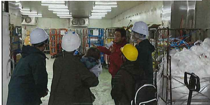
【7月27日 2グループ 5名】大王運輸(株)様にて