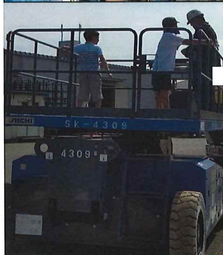
【8月24日 5グループ 15名】 (株)プライド 物流様