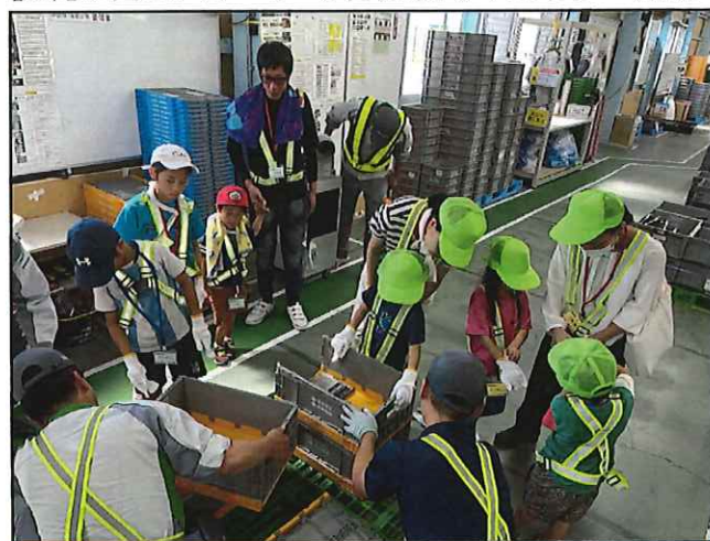
【8月9日3グループ 9名参加】↓カリツー(株)様