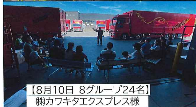
【8月10日 8グループ24名】 (株)カワキタエクスプレス様