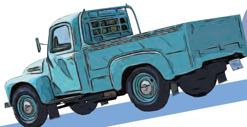
トヨペット トラック SG型 (1953年)