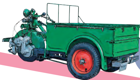
水野式 自動三輪車 (1937年)

本企画展では、輸送車両にかけた自動車メーカーの想いと、いつも私たちの生活を支えてくださる輸送に関わる皆さまに “感謝” をお伝えします。