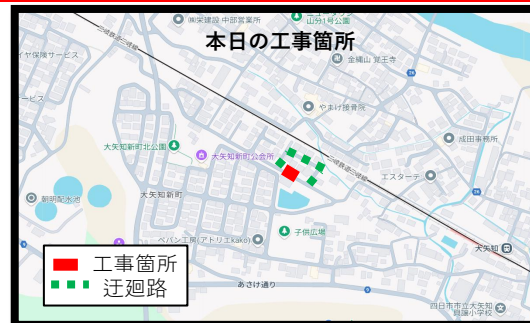
● 本日の工事箇所看板