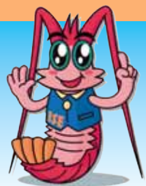
伊勢自動車道キャラクター 伊勢ユシの「イッサーくん」