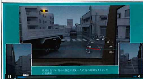
【イラストと音声で分かりやすい解説】