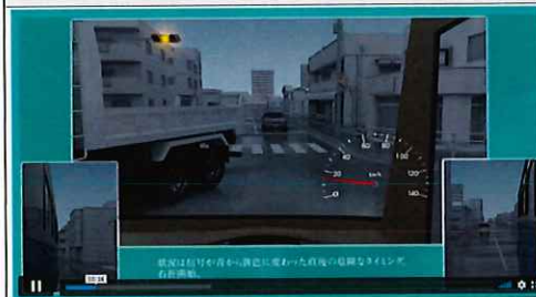
【イラストと音声で分かりやすい解説】